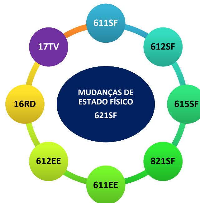
Diagrama 1: No diagrama acima podem ser vistos os códigos dos objetos educacionais que se inter-relacionam, tematicamente, com o 621SF (este OE): 611SF (Termômetros a gás e a líquido); 612SF (Termologia Aplicada); 615SF (Mudanças climáticas no planeta); 821SF (Construção de gráficos experimentais); 611EE (Termometria Experimental); 612EE (Capacidade Térmica e Calor Específico); 16RD (Calorimetria: entre o local e o global) e 17TV (Termodinâmica: a diferença que faz o calor).

*Clique sobre o título, ou digite: www.fisicavivencial.pro.br para acessar o site oficial do obra.