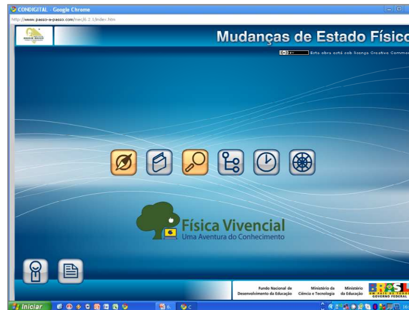
Figura 1: Tela de acesso da Plataforma Digital Complexmedia® – SOFTWARE (SF). O termo ‘complexmedia’ se refere ao fato de que o software reúne diferentes mídias, interligadas, com fins educacionais e vinculadas a um mesmo eixo temático.