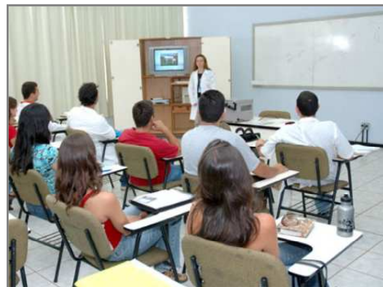
Foto 1: Há escolas que disponibilizam um televisor conectado a um computador, ou este ligado a um projetor multimídia. Objetos Educacionais podem ser fartamente utilizados nesses cenários, contribuindo para enriquecerem os temas investigados por estudantes e professores, com vistas à construção de conhecimento.

Sejam essas ou outras as estratégias didáticas escolhidas, os recursos digitais para a educação podem, se bem explorados didaticamente, representar um relevante elemento mediador nos processos de ensino-aprendizagem.