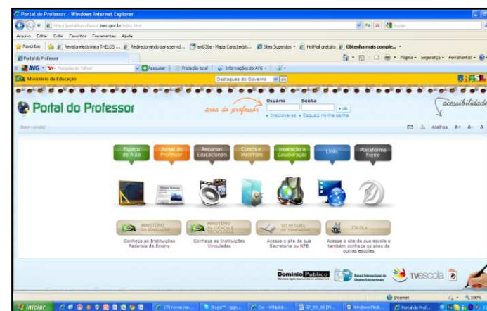
Figura 3: O Portal do Professor permite acesso aos objetos educacionais do BIOE, além de disponibilizar outros recursos que oferecem suporte às ações docentes, possibilitando a construção de aulas, participação em fóruns e chats, inscrição em programas de formação profissional continuada, contato com instituições, etc.