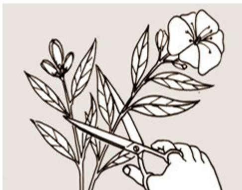
Figura 31a - Cortar os ramos da planta escolhida.