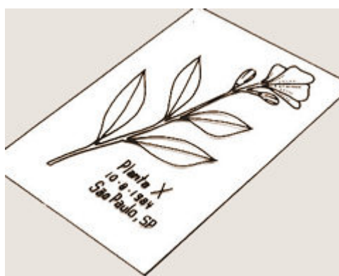
Figura 32b - Anotar na folha nomes da planta (científico e popular), data e local da coleta além do nome do coletor. Se necessário usar cola ou linha de costura para fixar a planta seca no papel. Guardar as plantas herborizadas em pastas, ao abrigo da poeira e umidade.