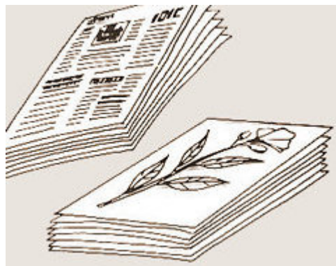
Figura 31b - Ajeitar as folhas, botões e frutos sobre papel.