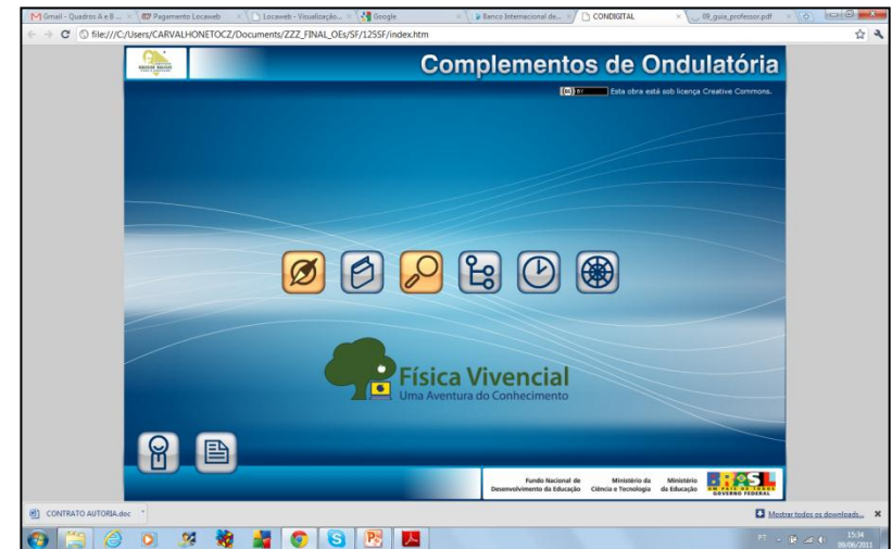
Figura 1: Tela de acesso da Plataforma Digital Complexmedia® – SOFTWARE (SF). O termo ‘complexmedia’ se refere ao fato de que o software reúne diferentes mídias, interligadas, com fins educacionais e vinculadas a um mesmo eixo temático.