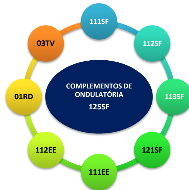
Diagrama 1: No diagrama acima podem ser vistos os códigos dos objetos educacionais que se inter-relacionam, tematicamente, com o 125SF (este OE): 111SF (Ondas Mecânicas); 112SF (Fenômenos Ondulatórios); 113SF (Movimento Harmônico Simples); 121SF (Ondas eletromagnéticas: a luz); 111EE (Ondas Mecânicas); 112EE (Ondas Eletromagnéticas); 01RD (Ondas Sonoras) e 03TV (Ondas Eletromagnéticas).

*Clique sobre o título ou digite: www.fisicavivencial.pro.br para acessar o site oficial do obra.