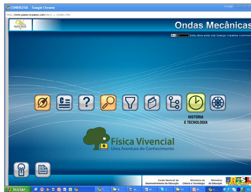
Figura 1: Tela de acesso da Plataforma Digital Complexmedia® – SOFTWARE (SF). O termo ‘complexmedia’ se refere ao fato de que o software reúne diferentes mídias, interligadas, com fins educacionais e vinculadas a um mesmo eixo temático.