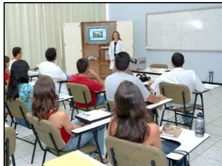
Foto 1: Há escolas que disponibilizam um televisor conectado a um computador, ou este ligado a um projetor multimídia. Objetos Educacionais podem ser fartamente utilizados nesses cenários, contribuindo para enriquecerem os temas investigados por estudantes e professores, com vistas à construção de conhecimento.

Sejam essas ou outras as estratégias didáticas escolhidas, os recursos digitais para a educação podem, se bem explorados didaticamente, representar um relevante elemento mediador nos processos de ensino-aprendizagem.