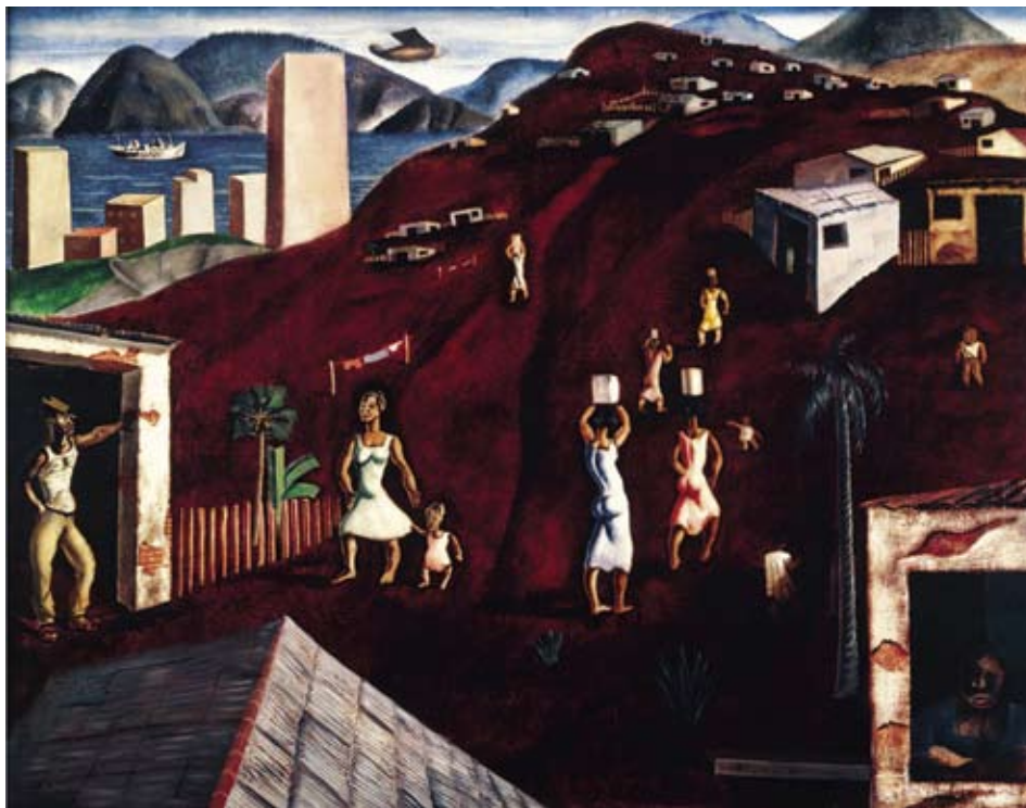
Candido Portinari , "Morro" – 1933 Pintura a óleo/tela - 144 x 146 cm