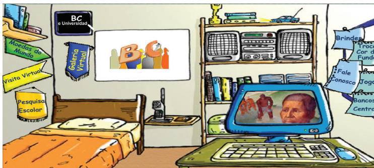
FIGURA 6 – PÁGINA PORTAL DO BANCO CENTRAL

O Banco Central também traz um espaço para jovens, o BC Jovem. Nesse sítio há conteúdos que auxiliam na pesquisa escolar, como: uma galeria virtual de moedas do mundo, um sistema para conversão de moedas, conteúdos para download sobre a história das cédulas, moedas e do sistema monetário brasileiro, entre outros.