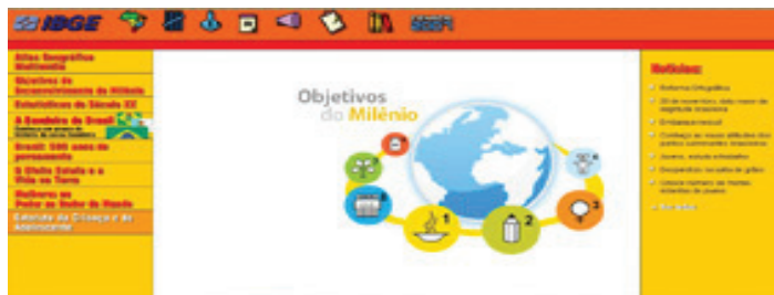
FIGURA 5 – PÁGINA IBGE TEEN

O Portal do Instituto Brasileiro de Geografia e Estatística (IBGE) conta com conteúdo especialmente para jovens, o IBGE Teen , que disponibiliza para download e visualização, mapas e estatísticas.