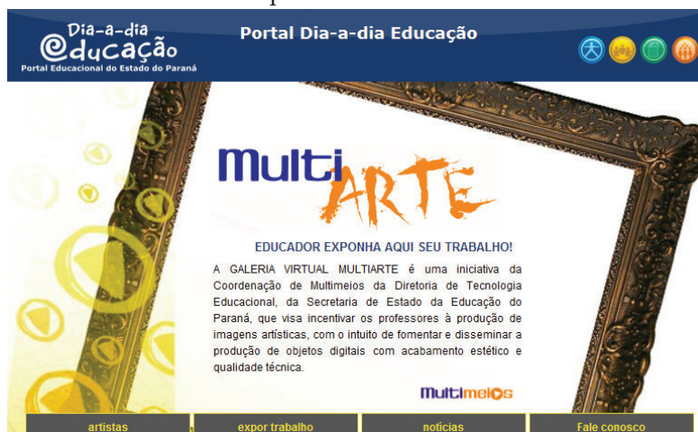
FIGURA 4 – PÁGINA GALERIA MULTIARTE

Já a Galeria Virtual Multiarte é um espaço que pode ser utilizado pela comunidade escolar que deseja conhecer e buscar produções artísticas. Uma iniciativa da Coordenação de Multimeios, vinculada à Diretoria de Tecnologia Educacional da Secretaria de Estado da Educação do Paraná, que visa incentivar os professores à produção de imagens artísticas, com o intuito de fomentar e disseminar a produção de objetos digitais com acabamento estético e qualidade técnica.