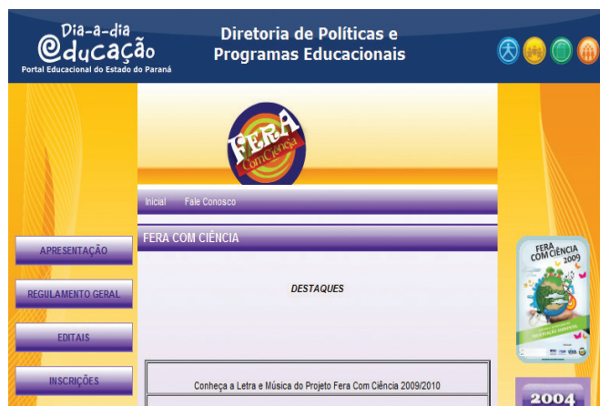
FIGURA 3 – PÁGINA FERA COM CIÊNCIA

Ainda no Portal Dia-a-Dia Educação pode ser localizado o sítio do Programa Fera Com Ciência . O projeto tem por intuito incentivar a pesquisa escolar, reunindo alunos das escolas públicas estaduais para apresentação de pesquisas nas áreas artística, científica e tecnológica, realizado durante o período letivo. Os resultados estão publicados no sítio.